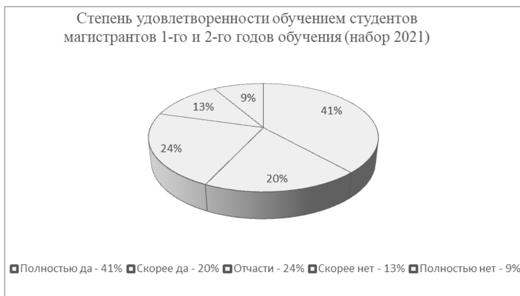
Рис. 2. Степень удовлетворенности студентов обучением в магистратуре