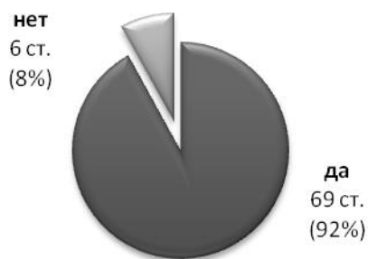
Рис. 3 Подготовка презентации с использованием полимедийных средств является более интересной и мотивирующей, чем обычное выступление

По мнению большинства (92%) участников анкетирования, подготовка презентации с мультимедийными элементами является более интересной и мотивирующей, чем обычное выступление без опоры на полимедийные средства, поскольку одновременное воздействие на разные органы чувств улучшает усвоение материала, реализуя принцип наглядности. Роль наглядности в познании объективной реальности состоит в том, что на основе «ощущений и восприятий, результатом которых является возникновение наглядных образов, формируются процессы более высокого порядка, связанные с деятельностью памяти и мыслительной деятельностью человека» [2: 274]. Действительно, полимедийное предъявление информации при подготовке и проведении презентации стимулирует мыслительную деятельность учащихся за счёт воздействия наглядных образов на их сознание.