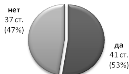
Рис. 2. Работа со студентом с более низким, чем у вас, уровнем владения языком является более интересной.

Совместная подготовка презентации в полимедийном формате является мотивирующей не только для учащихся с достаточной языковой подготовкой, которые могут проявить свою творческую индивидуальность и лидерские качества, но и для студентов с менее высоким уровнем владения языком. Мотивация последних повышается за счёт того, что они ощущают себя равноправными участниками творческого процесса и приобретают большую уверенность в своих языковых возможностях, поскольку перед ними стоит задача подготовить полимедийную часть презентации.