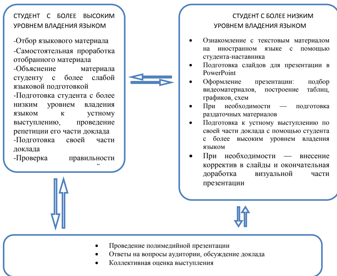
Рис. 1. Этапы подготовки и проведения полимедийной презентации

На схеме, приведённой ниже на Рис.1, показаны этапы подготовки и проведения иноязычной полимедийной презентации.