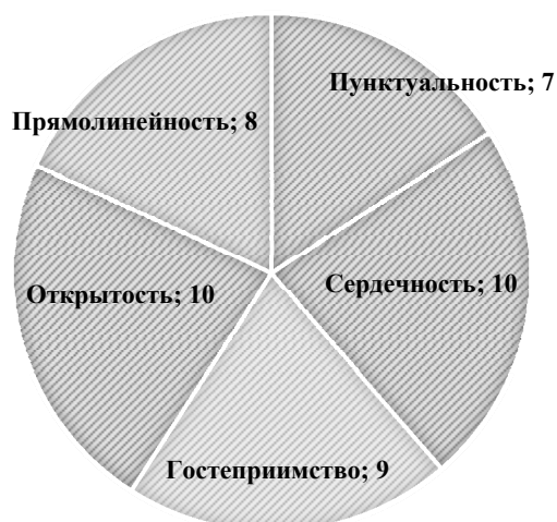
Диаграмма 3. Характерные черты русской культуры, по мнению немецких студентов