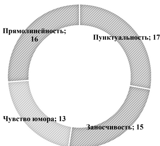
Диаграмма 4. Характерные черты немецкой культуры по мнению российских студентов

Целью данной анкеты является выявление приверженности студентами стереотипам. Из результатов анкетирования немецких студентов можно сделать вывод, что студенты из Германии менее подвержены влиянию стереотипов. 10 из 10 немецкоговорящих студентов отметили, что русской культуре свойственна открытость и сердечность. 9 студентов ответили, что культура русскоязычного населения является гостеприимной. 8 студентов из 10 отметили прямолинейность у представителей