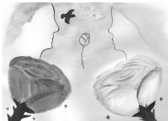
Иллюстрация к стихотворению «A White Rose»