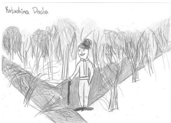
Иллюстрация к стихотворению «The road not taken»