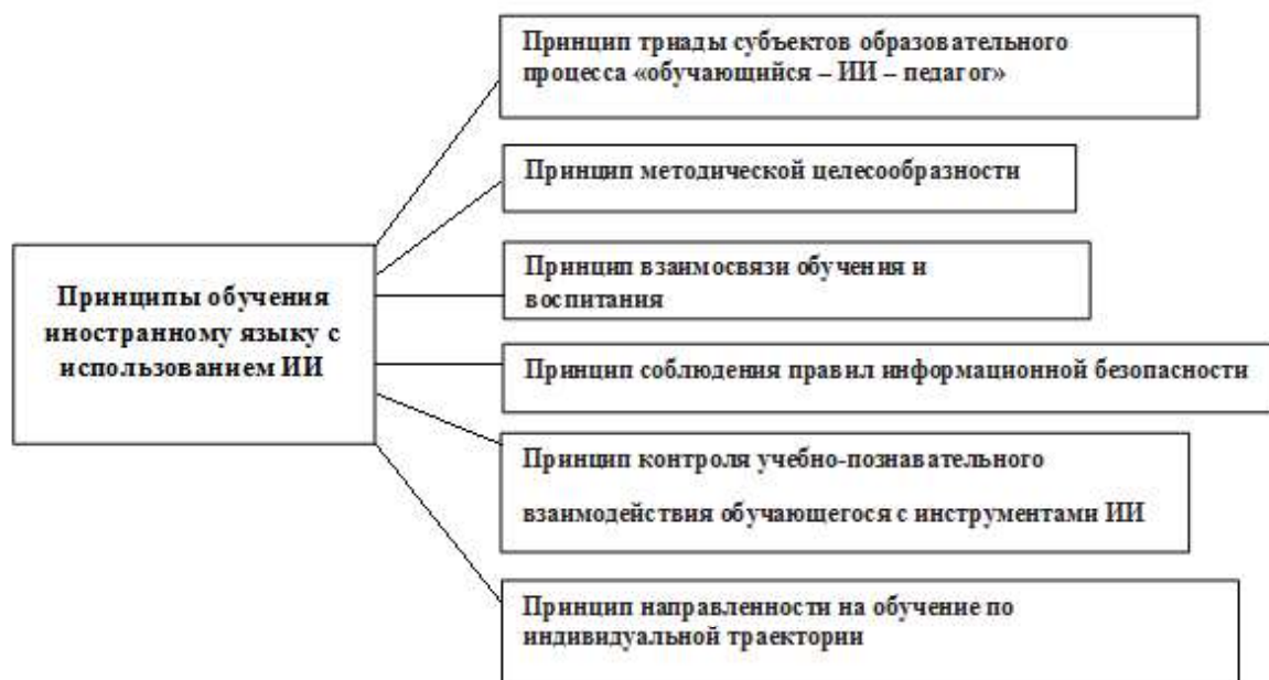
Рис. 1. Принципы обучения иностранному языку с использованием инструментов искусственного интеллекта [Сысоев 2024]