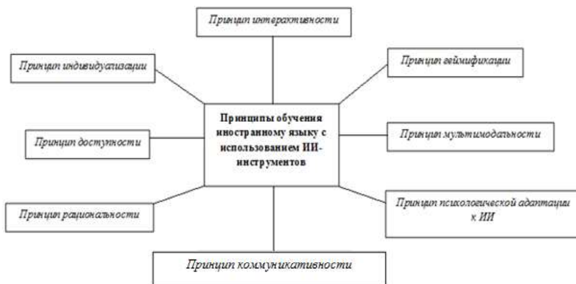
Рис. 2. Принципы обучения иностранному языку с использованием инструментов искусственного интеллекта